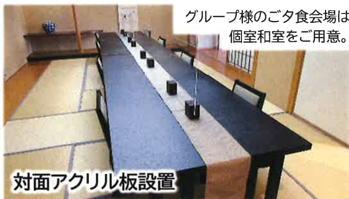
グループ様のご夕食会場は 個室和室をご用意。