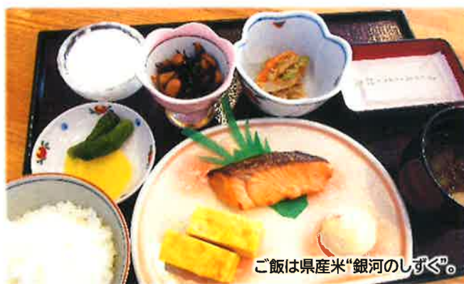
ご飯は県産米“銀河のしずく”。