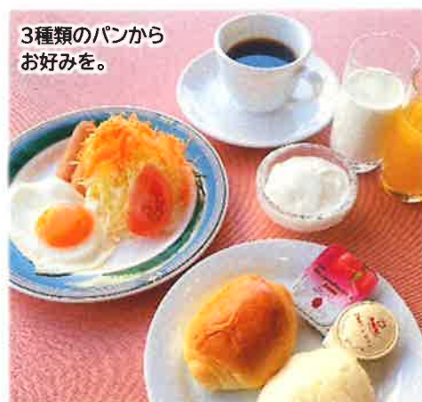
3種類のパンから お好みを。