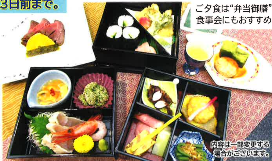
ご夕食は“弁当御膳” 食事にオススメです

※「盛岡の宿応援割」…盛岡市が実施する、岩手県居住者を対象とした宿泊割引事業で、一泊 3,000 円の割引ができます。(事前予約必要) ※「いわて旅応援プロジェクト」…岩手県が実施する、岩手県居住者を対象とした宿泊割引事業で、割引金額は宿泊金額に応じて設定されております。