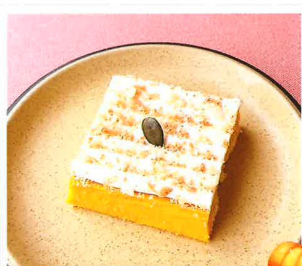
かぼちゃのタルト