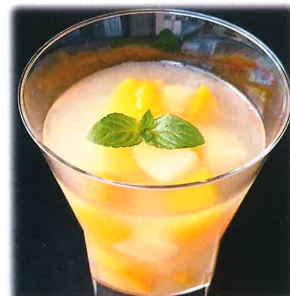
フルーツたっぷりゼリー