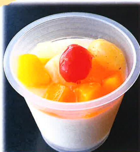
フルーツ杏仁豆腐