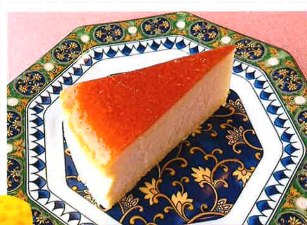
定番のチーズケーキ