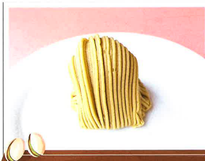
ピスタチオのモンブラン